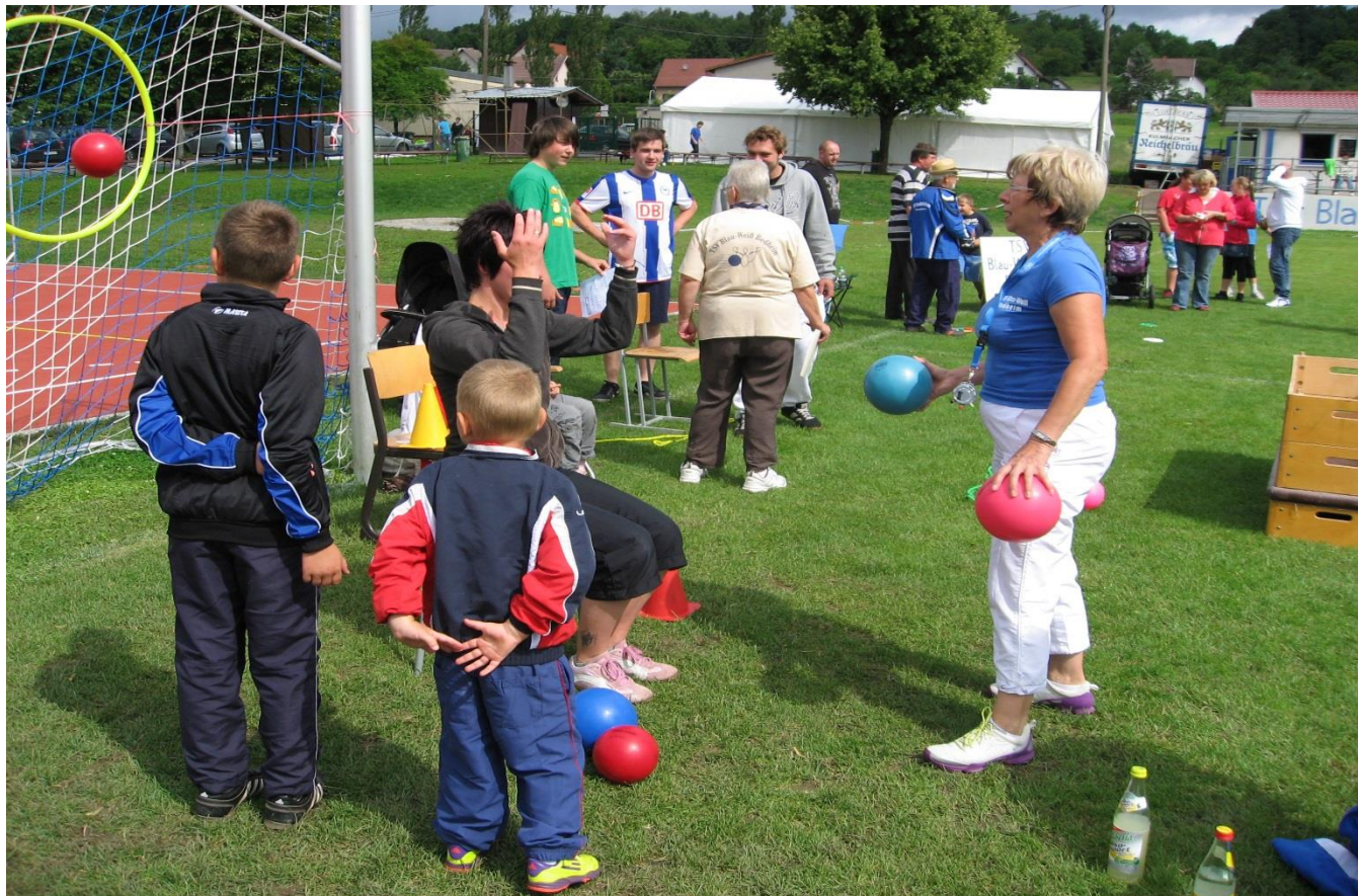
Familiensportfest Bedheim 2014

❖ Seit 2004 wird das überregionale Familiensportfest, im Rahmen der Sportwochen in Bedheim aktiv organisiert und durchgeführt.