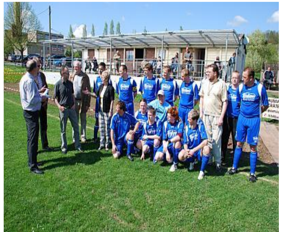
1. Mannschaft Blau – Weiss Bedheim