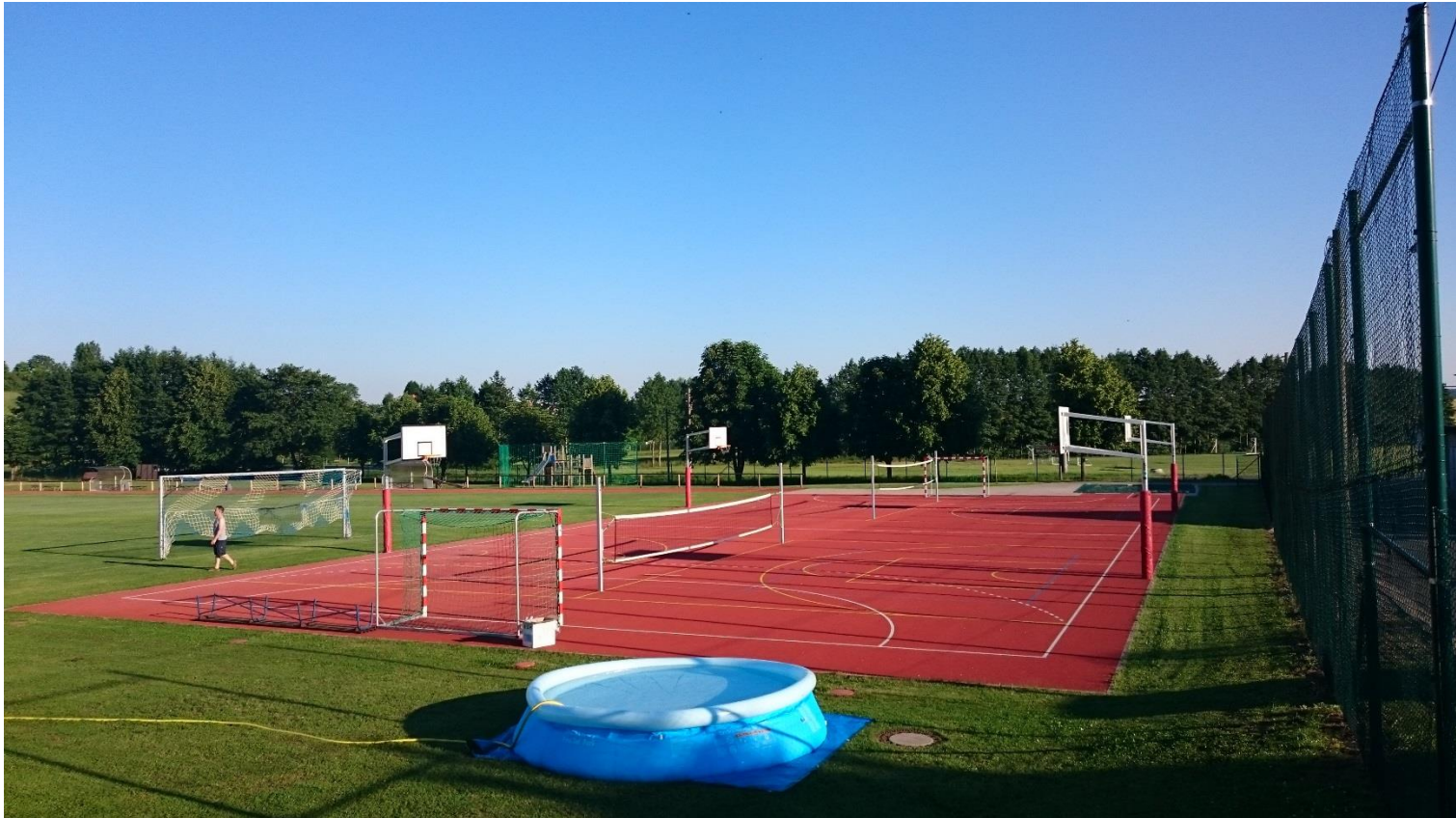
Sportanlage Bedheim 2015

Hier ein herrlicher Blick auf unsere sanierte Freisportanlage.